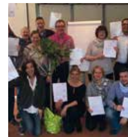
Impressionen der letzten Ausbildungen im Landhaus Eggert ****